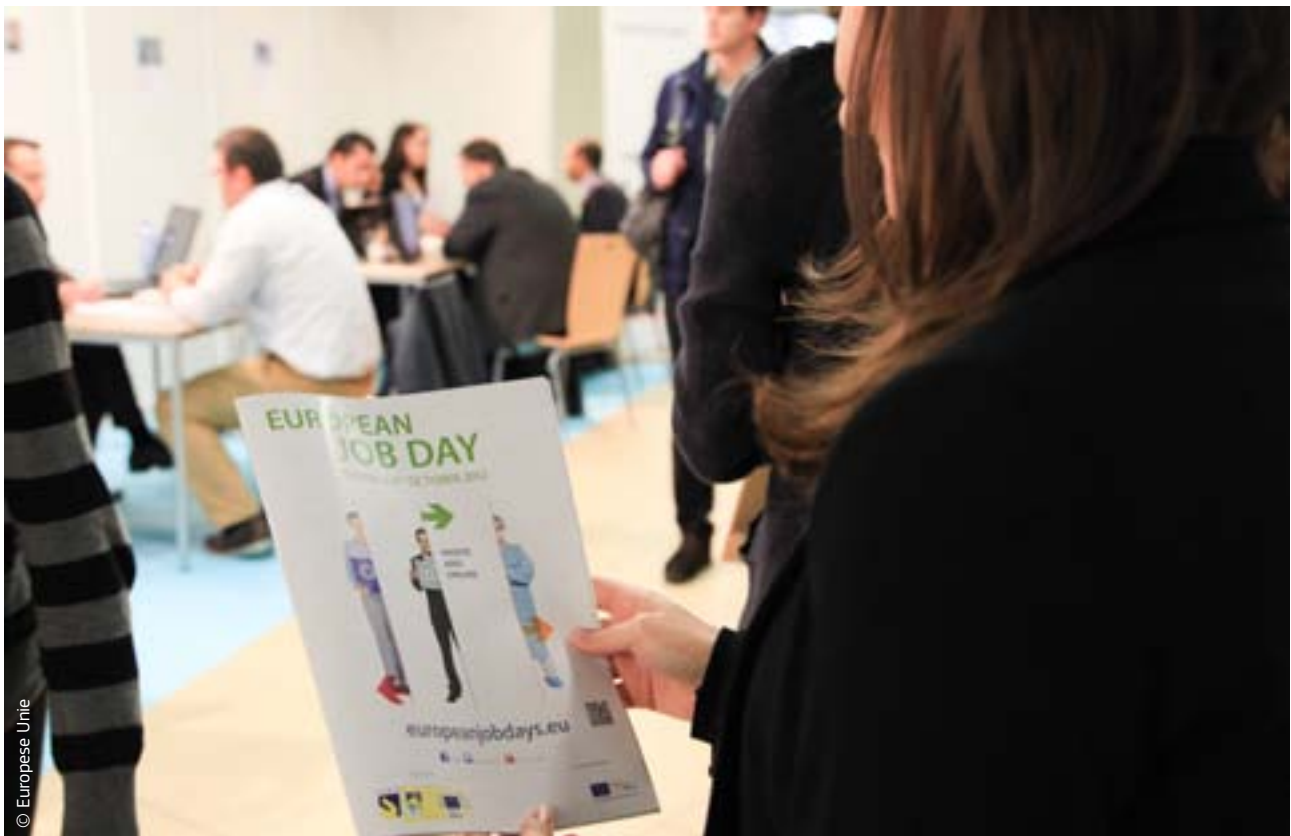
De EU heeft voorstellen gedaan om de werkloosheid in Europa aan te pakken.