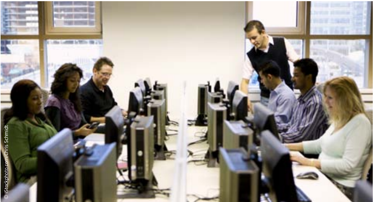
Het Europees Fonds voor aanpassing aan de globalisering helpt werknemers in de EU die hun baan zijn kwijtgeraakt, om nieuw werk te vinden of een opleiding te volgen.

Het in 2006 opgerichte Europees Fonds voor aanpassing aan de globalisering (EFG) springt bij als in een bedrijf of sector binnen een regio minstens 500 werknemers hun baan verliezen ten gevolge van de globalisering en als dat waarschijnlijk een grote impact zal hebben op die regio of sector. In 2011 heeft het EFG meer dan 21 000 werknemers geholpen een nieuwe baan te vinden en nieuwe talenten te ontwikkelen. In totaal hebben al ongeveer 91 000 ontslagen werknemers steun van het EFG gekregen, o.a. voor opleidingen en het zoeken naar werk. In 2011 heeft het EFG 128 miljoen € besteed om ontslagen werknemers te helpen in 12 landen (België, Denemarken, Duitsland, Frankrijk, Griekenland, Ierland, Italië, Nederland, Oostenrijk, Polen, Portugal en Tsjechië). De maatregelen werden voor 65 % gefinancierd door het EFG, en de resterende 35 % kwam van de betrokken EU-landen zelf. De ontslagen werknemers ontvingen intensieve persoonlijke bijstand bij het zoeken van werk, allerlei beroepsopleidingen, bij- en nascholingen en tijdelijke stimulansen en uitkeringen. Het EFG gaf ook steun voor de oprichting van nieuwe bedrijven en voor banen bij de overheid.