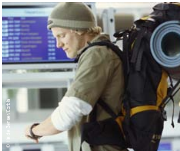
EU-initiatieven zoals „Jeugd in beweging” helpen jongeren een baan te vinden in een ander EU-land.

Eures is een samenwerkingsnetwerk tussen de Europese Commissie en overheidsinstanties in de EU-landen en in IJsland, Liechtenstein, Noorwegen en Zwitserland. Op de 25-talige website staan momenteel 1,3 miljoen vacatures in 31 landen en cv's van werkzoekenden. Het netwerk beschikt over 850 medewerkers die advies en bijstand geven aan mensen die werk zoeken of anderen willen aanwerven, en die informatie geven over wonen en werken in andere EU-landen. Eures legt iedere maand 150 000 contacten tussen werkzoekenden en werkgevers, wat leidt tot 50 000 aanwervingen per jaar. De actie „Je eerste Eures-baan” moet jongeren uit Denemarken, Duitsland, Italië en Spanje helpen in een ander EU-land werk te vinden.