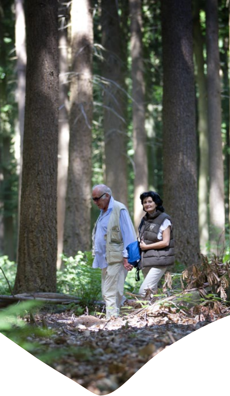
Ommetje Kasteelbos Tillegem (3 km)