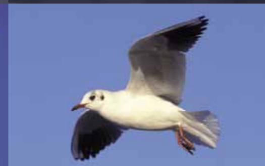
Kokmeeuw (winter) L 34-37 | S 100-110 | G 225-351 16