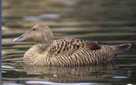
Eidereend (vrouwje) L 50-71 | S 80-108 | G 1200-2800 2