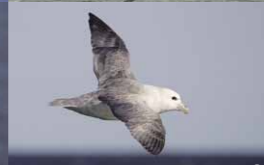
Noordse stormvogel L 45-50 | S 100-112 | G 700-900 10