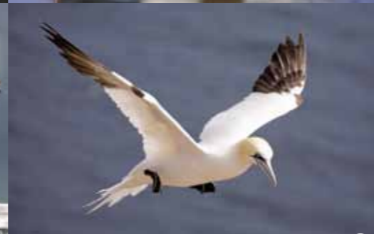
Jan-van-gent L 90-100 | S 170-180 | G 2800-3200 9