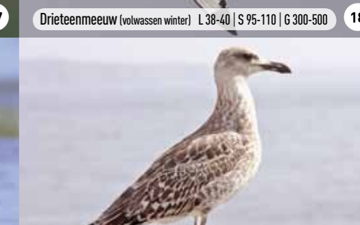
Grote mantelmeeuw (1e jaar) L 64-78 | S 150-170 | G 1000-2100 24