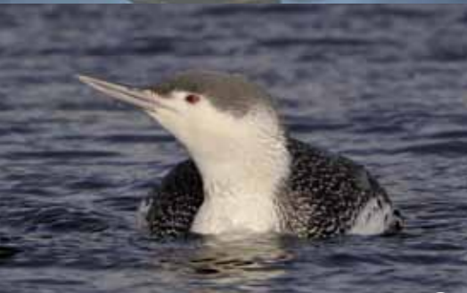
Roodkeelduiker (winter) L 55-69 | S 110-120 | G 1200-1600 7