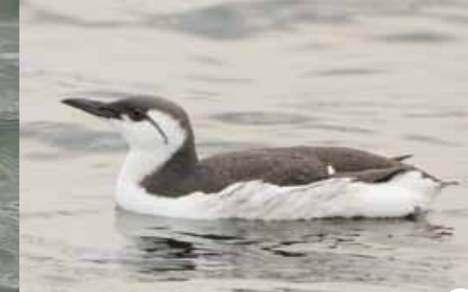
Zeekoet (winter) L 38-41 | S 63-67 | G 590-730 5