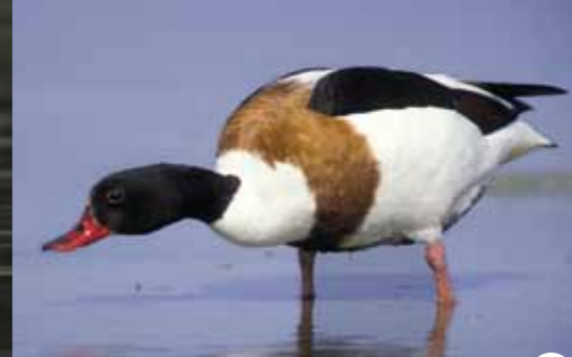
Bergeend (volwassen) L 58-71 | S 110-130 | G 850-1400 3