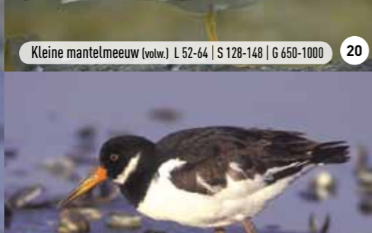
Scholekster (winter) L 40-45 | S 80-85 | G 400-700 26