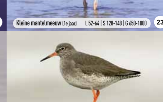
Tureluur (winter) L 27-29 | S 45-52 | G 85-155 29