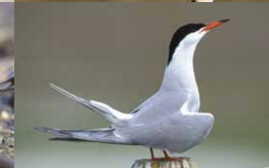
Visdief (volwassen, broedkleed) L 31-35 | S 82-95 | G 90-150 12