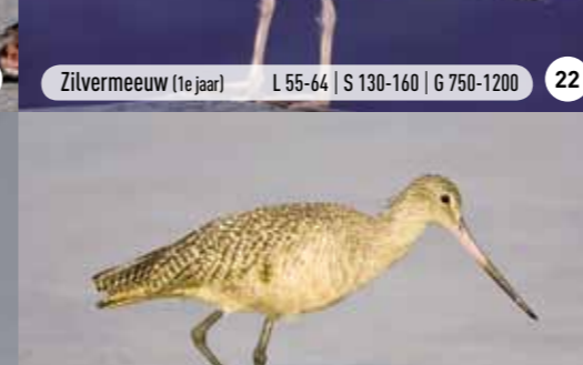
Rosse grutto (winter) L 37-39 | S 61-68 | G 280-450 28