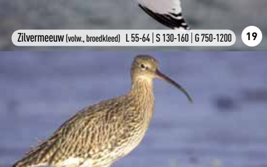
Wulp L 50-60 | S 80-100 | G 575-950 25