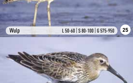
Bonte strandloper (winter) L 16-20 | S 35-40 | G 40-50 31