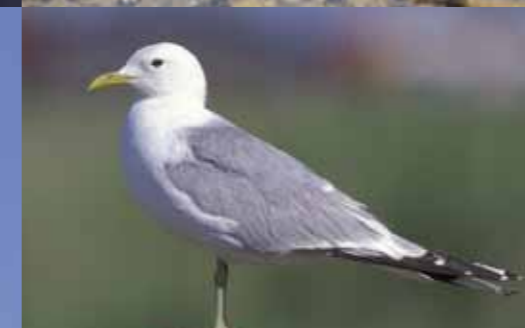
Stormmeeuw (volw., broedkleed) L 40-43 | S 105-125 | G 300-500 17