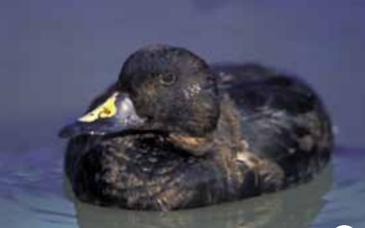
Zwarte zee-eend (mannetje) L 45-54 | S 79-90 | G 1200-1400 1