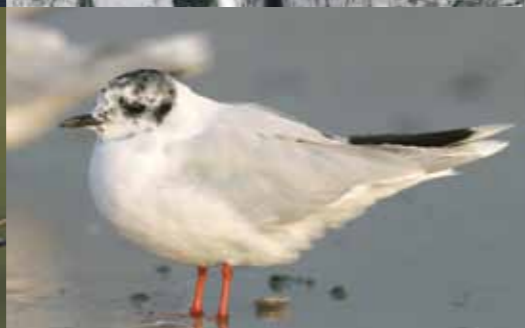
Dwergmeeuw (volwassen) L 25-27 | S 70-77 | G 90-150 14