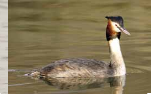
Fuut (broedkleed) L 46-51 | S 85-90 | G 800-1000 6