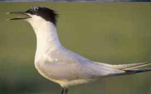
Grote stern (volwassen, broedkleed) L 36-41 | S 95-105 | G 210-260 13