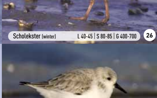
Drieteenstrandloper (winter) L 20-21 | S 36-39 | G 50-60 32