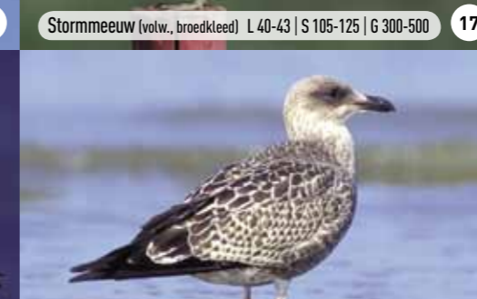
Kleine mantelmeeuw (1e jaar) L 52-64 | S 128-148 | G 650-1000 23