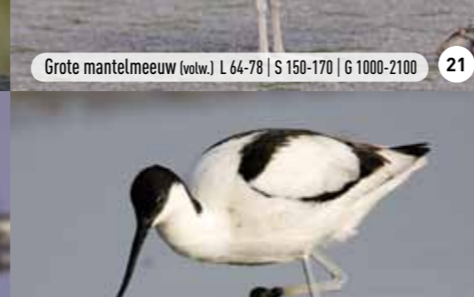
Kluut L 42-45 | S 67-77 | G 250-400 27