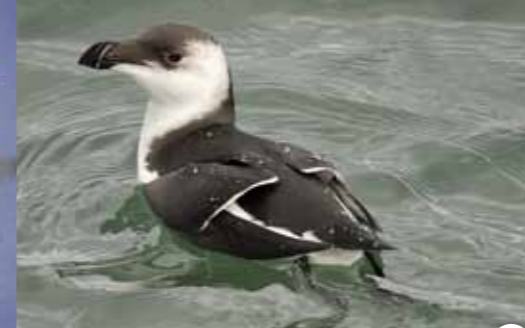
Alk (winter) L 37-39 | S 63-67 | G 590-730 4