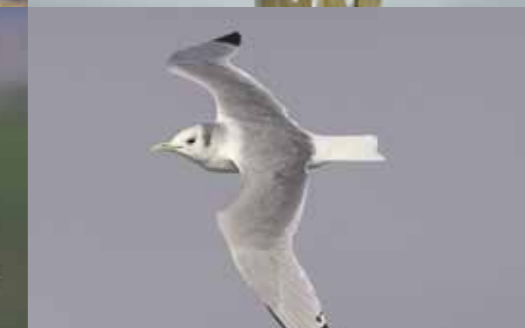
Drieteenmeeuw (volwassen winter) L 38-40 | S 95-110 | G 300-500 18