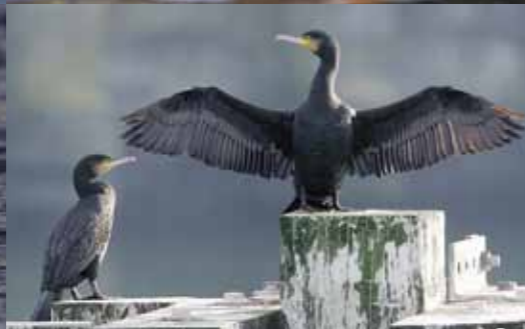
Aalscholver (winter) L 80-100 | S 130-160 | G 2000-2500 8