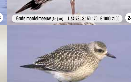
Zilverplevier (winter) L 27-30 | S 71-83 | G 200-250 30