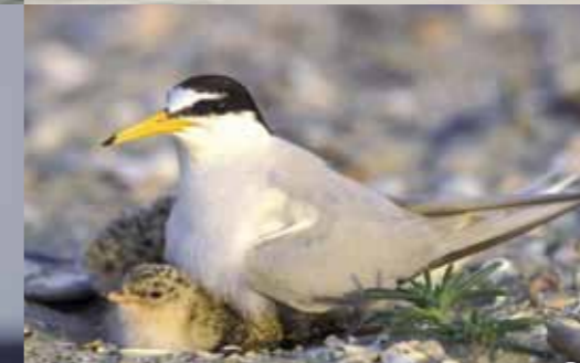
Dwergster (volwassen, broedkleed) L 22-24 | S 48-55 | G 50-65 11