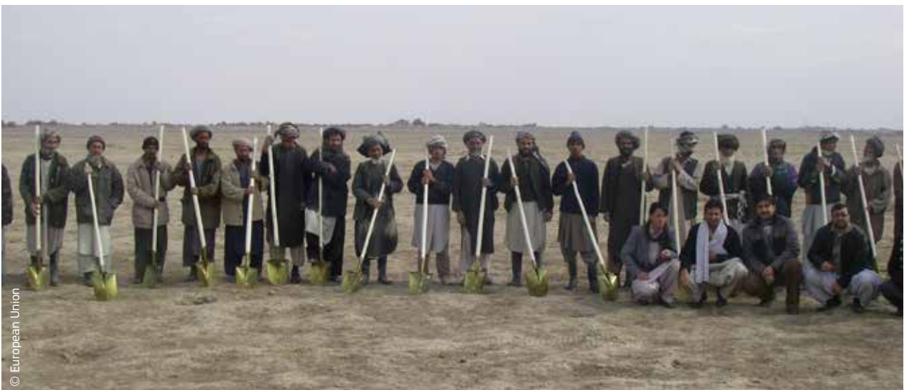
Afghanen ontvangen door ECHO gefinancierde hulpmiddelen tegen de droogte die tot honger en ontheemding heeft geleid.

In 2007 kwamen de EU-landen met een nieuw humanitair beleid. Benadrukt werd dat humanitaire hulp geen politiek instrument is en dat de hulp verleend moest worden volgens de fundamentele principes van neutraliteit, menselijkheid, onafhankelijkheid en onpartijdigheid. Ook werden de rollen van de