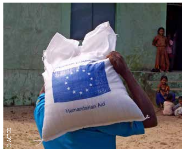
De EU verleent al sinds 1996 humanitaire hulp aan India.

De EU is een van de grootste hulpdonoren ter wereld. Haar bijdrage heeft een enorme invloed in crisisgebieden. Alleen al in 2012 heeft de EU hulp verleend aan 122 miljoen mensen in meer dan 90 niet-EU-landen.