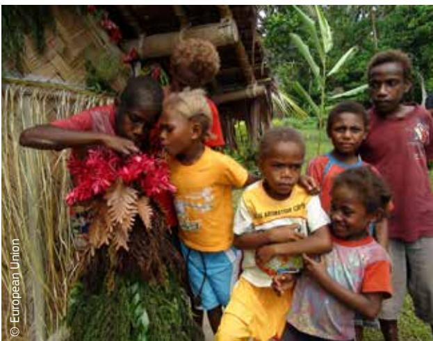
In Vanuatu helpen kinderen bij het bouwen van een model van de grootste bedreiging in hun leven: de vulkaan op Mount Gharat.

De aandacht van de Europese Commissie voor weerbaarheid zal meer levens redden, kostenefficiënter zijn en bijdragen aan het terugdringen van de armoede, waardoor hulp en het stimuleren van duurzame ontwikkeling ook meer effect zullen hebben.