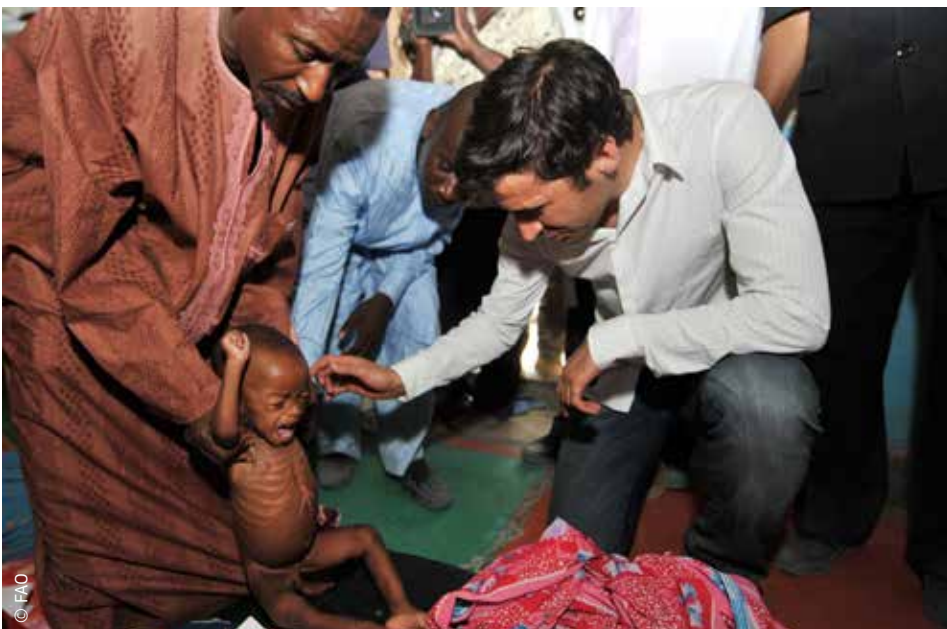
Raúl González brengt een bezoek aan Tsjaad in het kader van de campagne „Football against hunger”.

Het grootste deel van de humanitaire hulp van de EU is voedselhulp. In 2011 heeft de EU in totaal 509 miljoen € vrijgemaakt voor humanitaire voedselhulp.