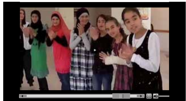
Onderwijs helpt kinderen in conflictgebieden kind te blijven.

De Europese Commissie wil projecten financieren om daar wat aan te doen. Ze heeft haar humanitaire partnerorganisaties en -agentschappen gevraagd met projectvoorstellen te komen. Er werd besloten dat het prijzengeld van de Nobelprijs onder de noemer van het EU-initiatief „Vredes-kinderen” naar vier projecten gaat. Deze projecten komen samen ten goede aan 23 000 kinderen in Irak, Colombia, Ecuador, Ethiopië, de Democratische Republiek Congo en Pakistan. De projecten bieden de kinderen kindvriendelijke plaatsen, bescherming, onderwijs en een kans op een betere toekomst.