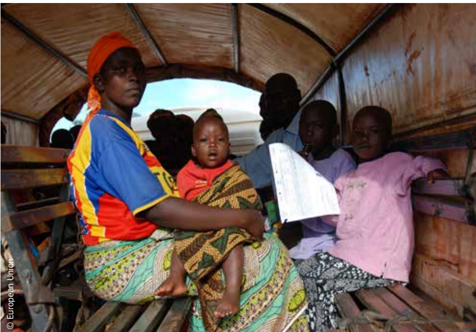
Dit Burundese gezin was ontheemd. Dankzij hulp van de EU konden zij naar huis terugkeren.

Om beter in te spelen op de langetermijneffecten van rampen, moeten humanitaire hulp en noodhulp hand in hand gaan met activiteiten op andere terreinen, zoals ontwikkelingssamenwerking en milieubescherming. Daarom is coördinatie op Europees niveau nodig.