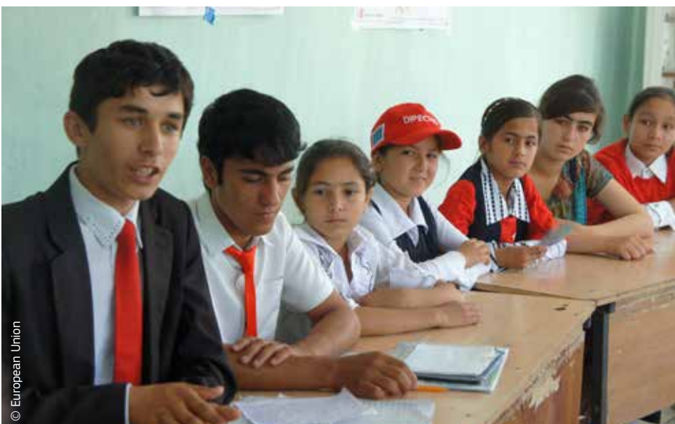
Vrijwilligers in Tadzjikistan die deel uitmaken van een noodhulpteam onder het Dipecho-programma, volgen een opleiding.

Daarnaast werden een grote bosbrand door vonken van een remmende trein en een overstroming in een dorp door een doorgebroken stuwdam gesimuleerd. Elk jaar worden dergelijke oefeningen georganiseerd, met een financiële bijdrage van de EU.